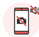
カメラ、音声、各種ボタン等の機能が正常に作動しない

・液晶に液漏れ、焼き付きがある ・タッチパネルの操作ができない ・縦線、横線がある