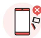
SIMトレイが不足、または損傷している