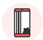
液晶表示が異常/ タッチパネルが動作不良

・液晶に液漏れ、焼き付きがある ・タッチパネルの操作ができない ・縦線、横線がある