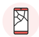
筐体が破損している