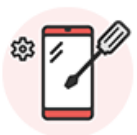
メーカー保証が対象外 (改造など)