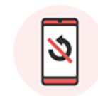
初期化されていない