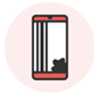
液晶表示が異常/ タッチパネルが動作不良

・液晶に液漏れ、焼き付きがある ・タッチパネルの操作ができない ・縦線、横線がある