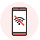
ネットワーク利用制限が かかっている