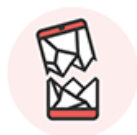
基板が断裂している