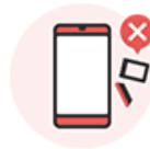
SIMトレイが不足、 または損傷している