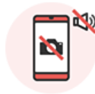
カメラ、音声、各種ボタン等の 機能が正常に作動しない

・液晶に液漏れ、焼き付きがある ・タッチパネルの操作ができない ・縦線、横線がある