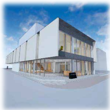
大容量 VR 画像の例(愛媛県歯科医師会館)

実証実験では、株式会社矢野青山建築設計事務所が作成した3D建築モデルを用いて、「ドコモオープンイノベーションクラウド」上でレンダリングした3Dデータを、VRヘッドセット「Oculus Quest 2(オキュラスクエスト 2)」端末に複数人同時に、ストリーミング配信して表示させました。